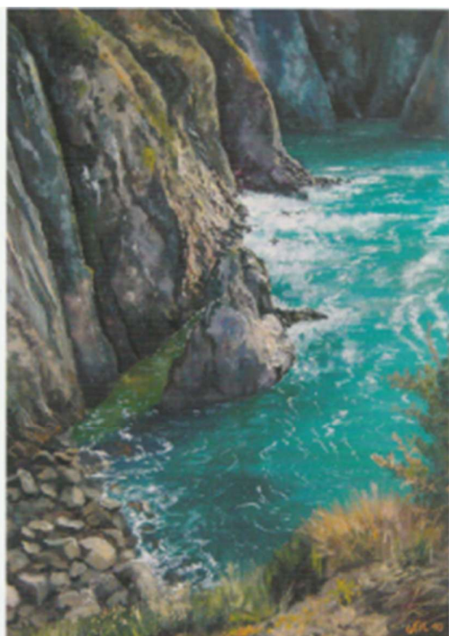
Les Reuses ou le 50ème rugissant, gouache, 70x50cm