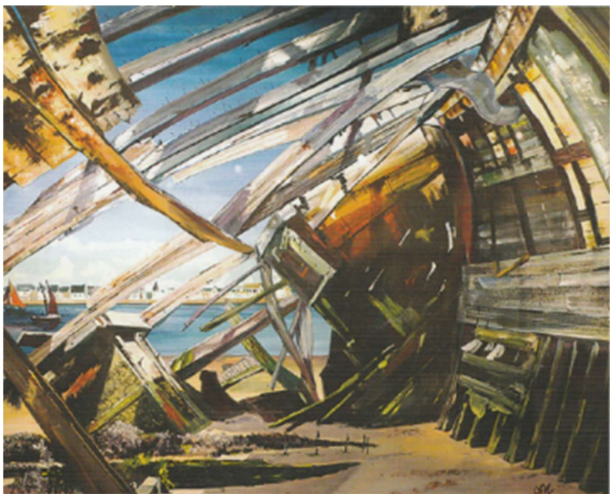
Eelinité, gouache, 70x100cm